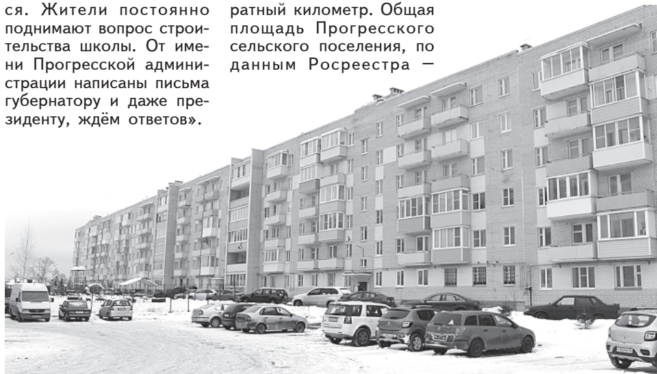
Прогресс. Улица Гагарина, дом № 20